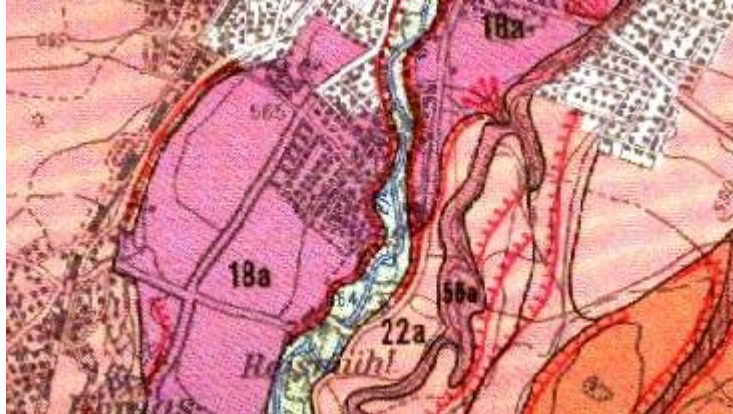
Abb. 3 Ausschnitt Standortkundliche Bodenkarte 1:50.000, München-Augsburg; ; Stand vom 26.11.2024

Im Plangebiet kommt gemäß Standortkundlicher Bodenkarte im Maßstab 1:50.000 ausschließlich der Bodentyp 22a Parabraunerde vor. Bei der Bodenart handelt es sich um einen flach- bis mittelgründigen Schotterverwitterungsboden z. T. mit dünner Deckschicht aus Hochflutlehm, Abschwemm Massen oder Lößlehm. Der Boden weist eine hohe bis sehr hohe Durchlässigkeit, ein geringes Filtervermögen und eine geringe bis mittlere Sorptionskapazität auf.