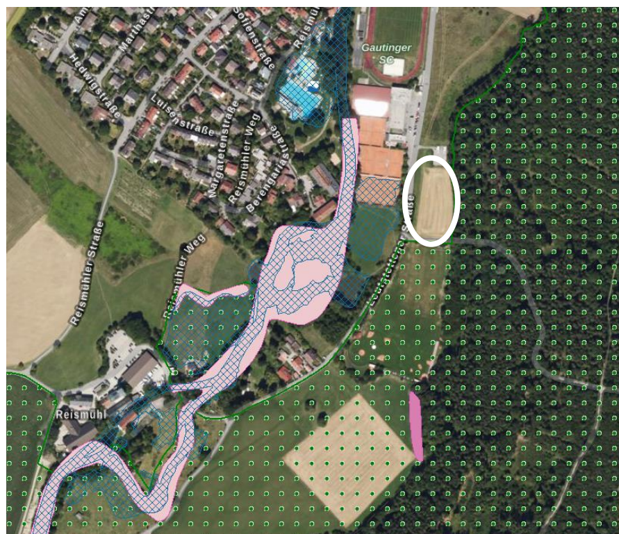
Abb. 2 Landschaftsschutzgebiet (grün), Biotope (rosa) und Überschwemmungsgebiete (blau), ohne Maßstab, Stand 12.11.2024